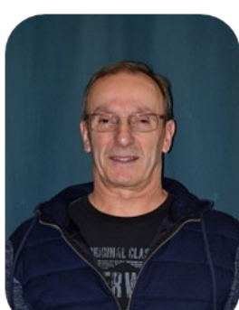
DALMAZZO Alain Accessibilité bâtiments publics Location de salles Cimetière Espace urbain Plages